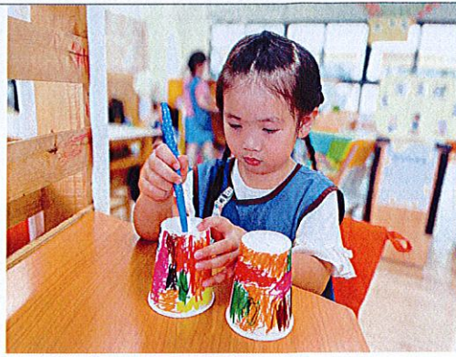
▲承芸幫杯子戳一個洞