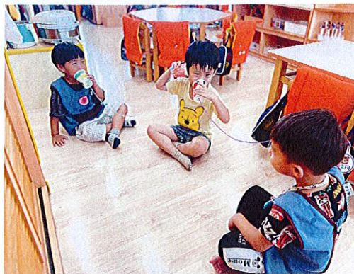
▲幼兒與好朋友用傳聲筒來說話