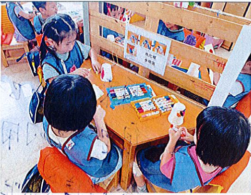
▲幼兒運用彩色筆在杯子上著色