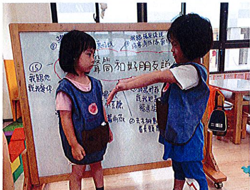
▲幼兒上台分享與好朋友說的話