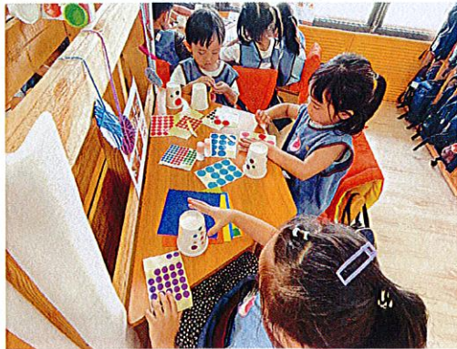
▲幼兒運用蠟筆和圓點點貼在杯子上著色