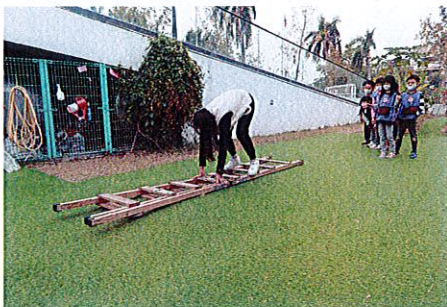
▲教師進行說明示範