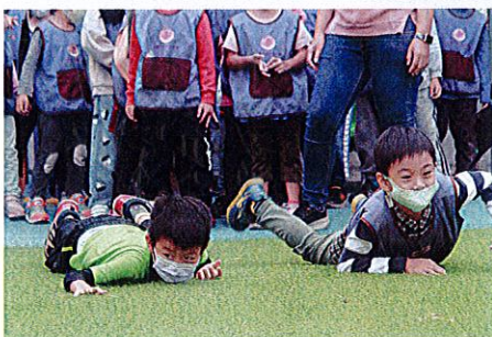
▲幼兒進階挑戰(匍匐前進)