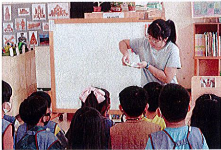
▲教師說明遊戲規則