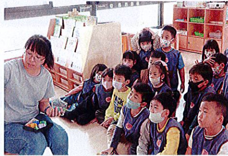
▲教師說明遊戲規則